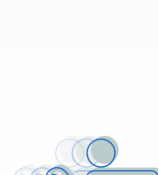
inspiratie & actie